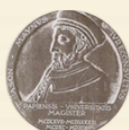
Ordine degli Avvocati di Pavia